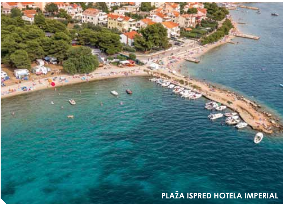
PLAŽA ISPRED HOTELA IMPERIAL