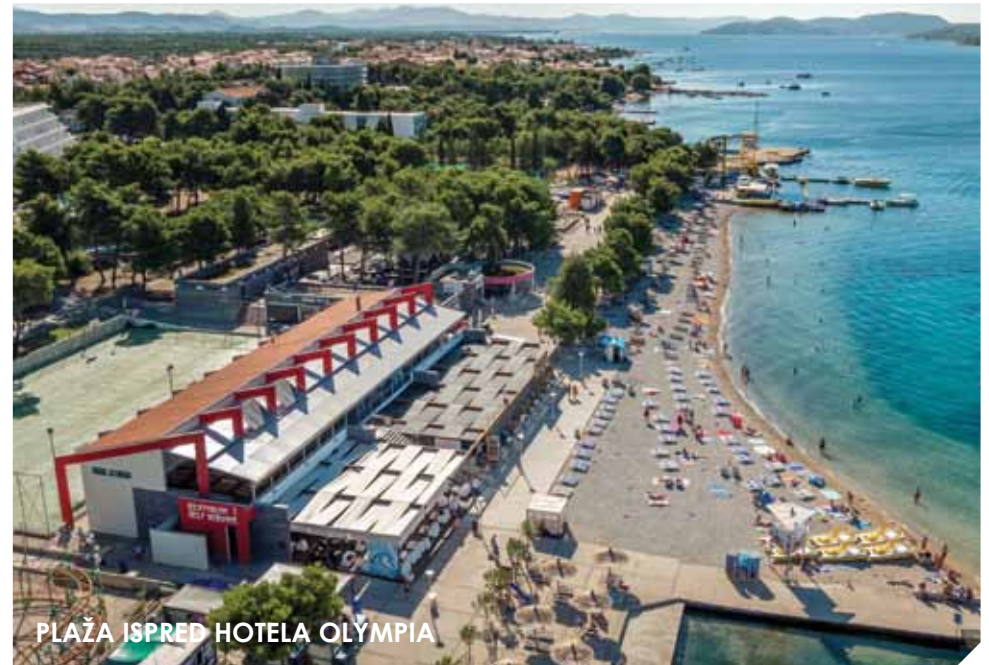
PLAŽA ISPRED HOTELA OLYMPIA